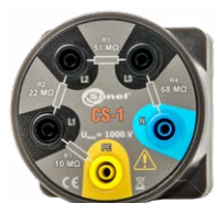
Adattatore cavo CS-1 WAADACS1