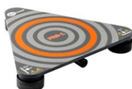
Sensore per misure della resistenza dei pavimenti e delle pareti PRS-1 WASONPRS1GB