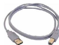
Cavo per trasmissione dati USB WAPRZUSB