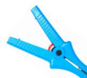
Terminale a coccodrillo blu 11 kV 32 A WAKROBU32K09