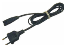
Cavo di alimentazione 230 V (pin IEC C7) WAPRZLAD230