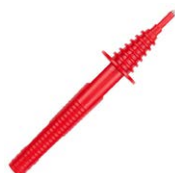
Terminale a puntale rosso 5 kV (innesto a banana) WASONREOGB2