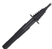
Terminale a puntale nero 5 kV (innesto a banana) WASONBLOGB2