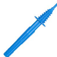
Terminale a puntale blu 1 kV (innesto a banana) WASONBUOGB1