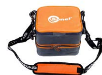
Custodia M-8 WAFUTM8